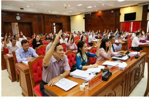
Kỳ 10 ngày thứ nhất là gì.